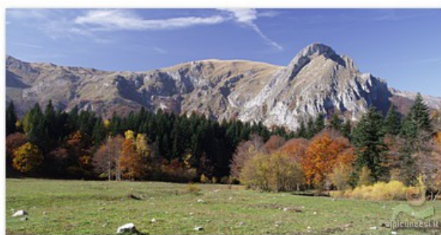
Pian del Creus e dorsale Marguareis