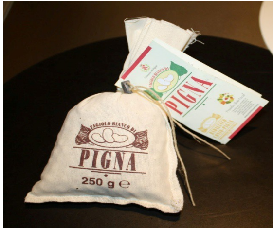
Farina di castagna