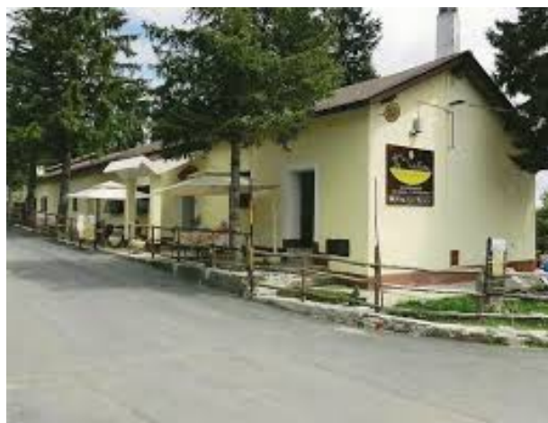
Locanda Colle Melosa