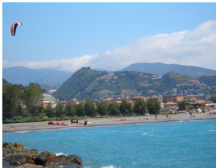
La spiaggia di Camporosso