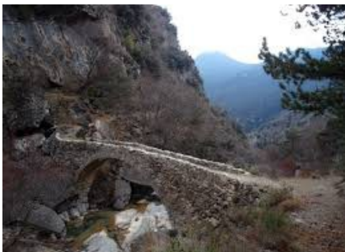
Ponte di Pau'