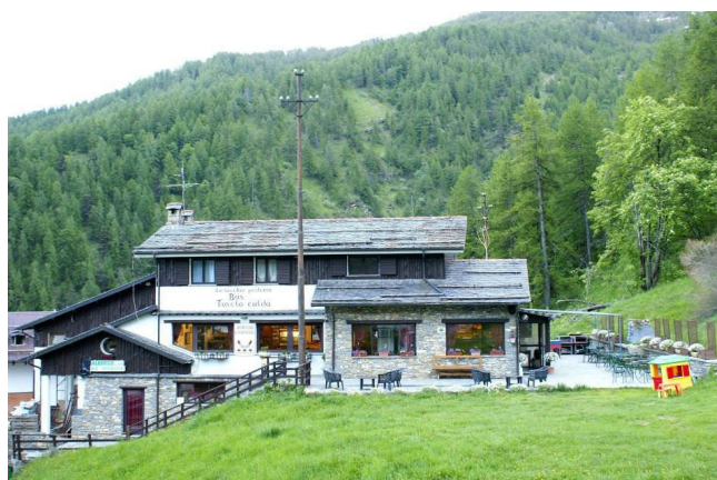
Albergo La vecchia partenza