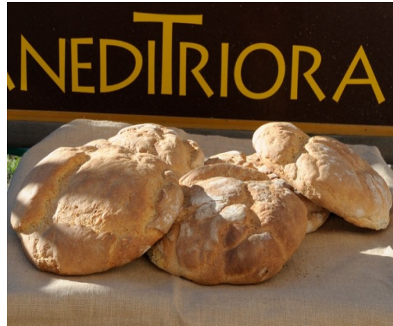
Pane di Triora

La cultura gastronomica delle Alpi Liguri è parte dell'eredità del passato di questo territorio, della vita di tutti i giorni e delle sue attività: la cura del bosco forniva legna da ardere, materiale da costruzione ma anche castagne e frutti del sottobosco; cereali, leguminose ed ortaggi venivano invece coltivati sui versanti più soleggiati, mentre l'allevamento garantiva il fabbisogno delle proteine animali con carne e latticini .