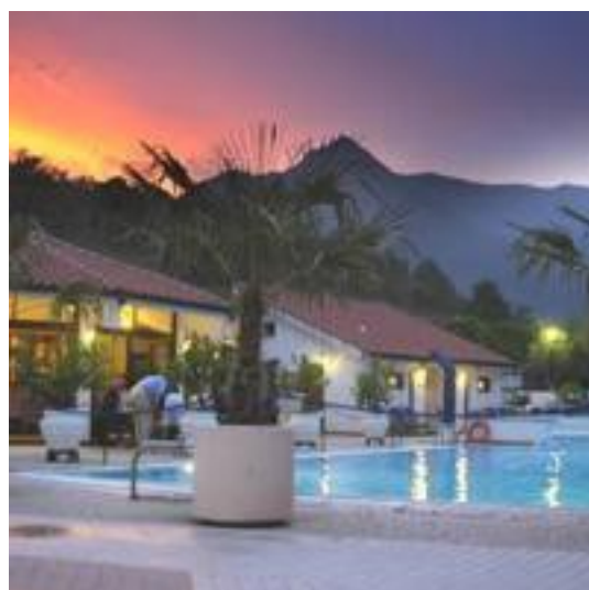
Hotel Lago Bin