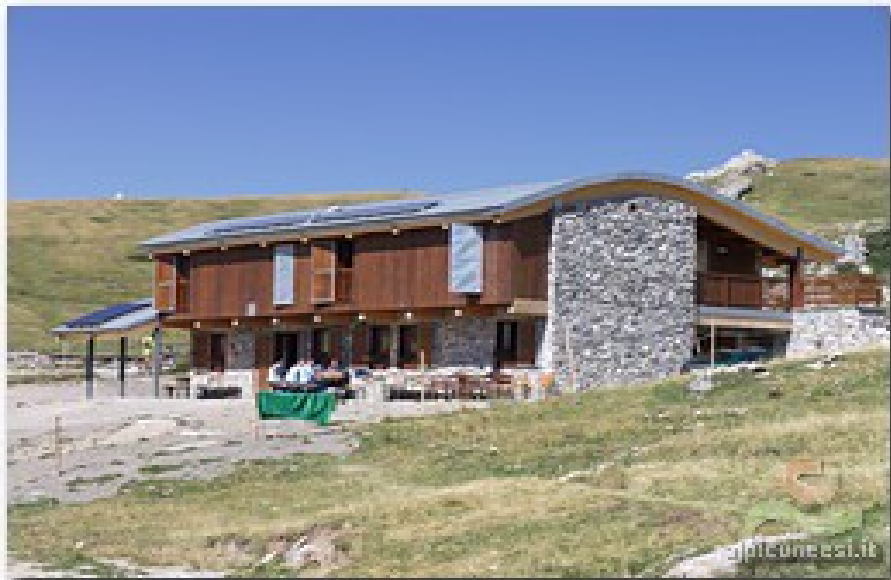
Rifugio Don Barbera