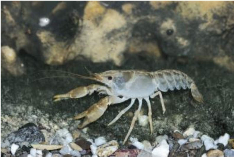
Gambero di Fiume