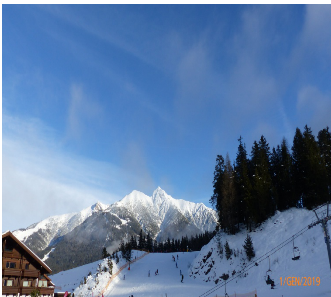
settimana bianca 2019 pista di discesa a Seefeld