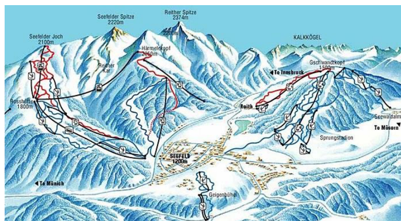
Piste da discesa Rosshutte e Seefeld

Consultare periodicamente il sito www.uetcaitorino.it per gli eventuali aggiornamenti