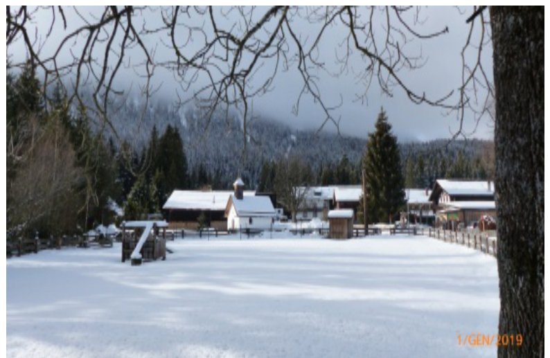
Settimana bianca 2019 - Altopiano di Seefeld