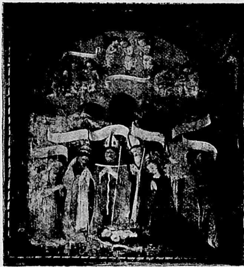
Affresco nella Chiesa di San Francesco

È notevole tutt'ora l'antico convento di S. Francesco, ora delle suore Orsoline. Si ammirano in questo edificio alcuni affreschi quattrocentisti e quello, ben conservato, entrando a destra nella chiesa.