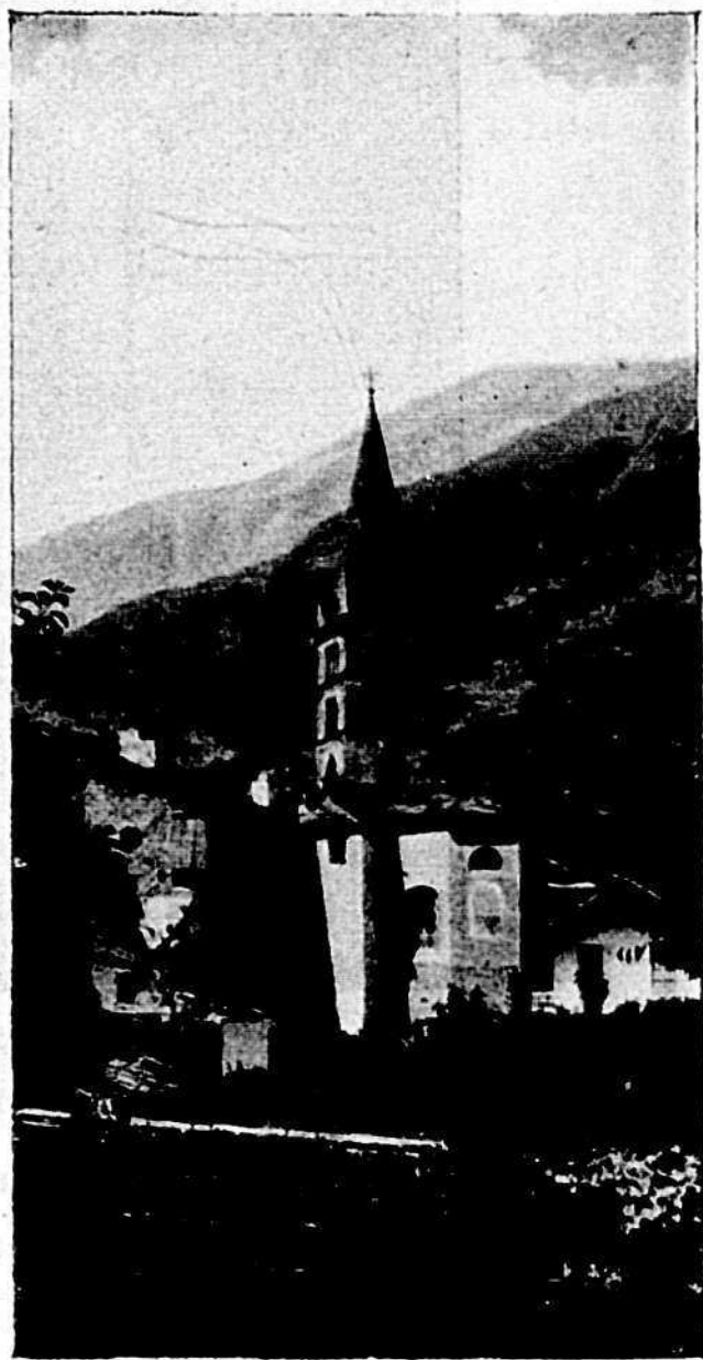
La Chiesa di Chiomonte

È degna di attenta osservazione la chiesetta che era dedicata a Santa Caterina, un gioiello architettonico, ora ridotta all'uso di... fienile.