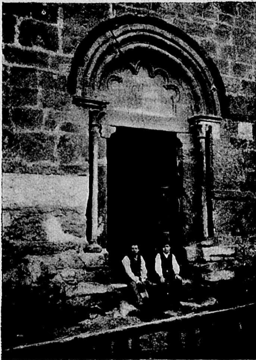
Portale della cappella di Santa Caterina, a Chiomonte

Il paramento della facciata e del fianco è formato da filari di bozze in pietra di diversa altezza ed il suo coronamento conserva una graziosa