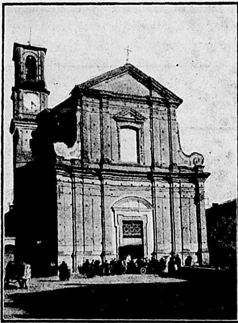
Chiesa Parrocchiale di Moretta

Non molto distante da Faule, attraversando ubertose campagne, ci si presenta Moretta grazioso paesello, che ha nella storia e nell'arte fatti tali, degni di essere ricordati ai suoi visitatori.