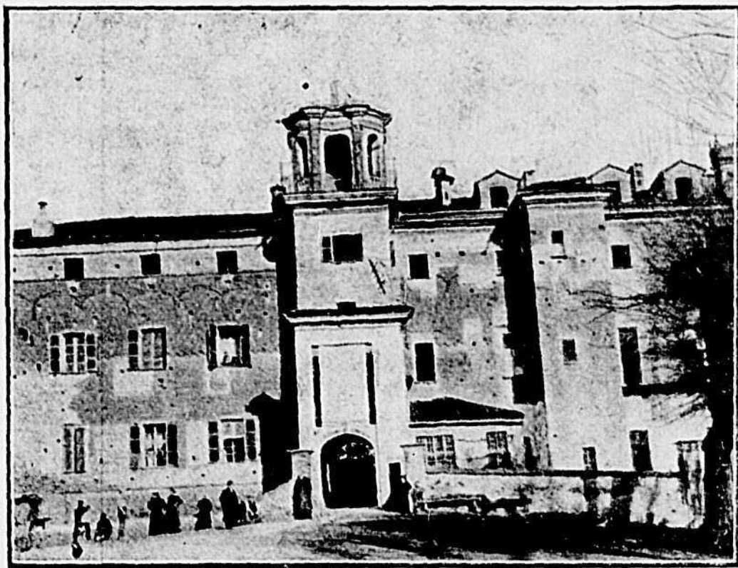
Il Castello di Moretta (Fot. G. Vaccarino)

Secondo la tradizione il territorio fu dissodato dai monaci di S. Benigno di Fruttuaria, nella Marca di Ivrea, fondato prima del 1005 e famoso monastero in quei tempi.