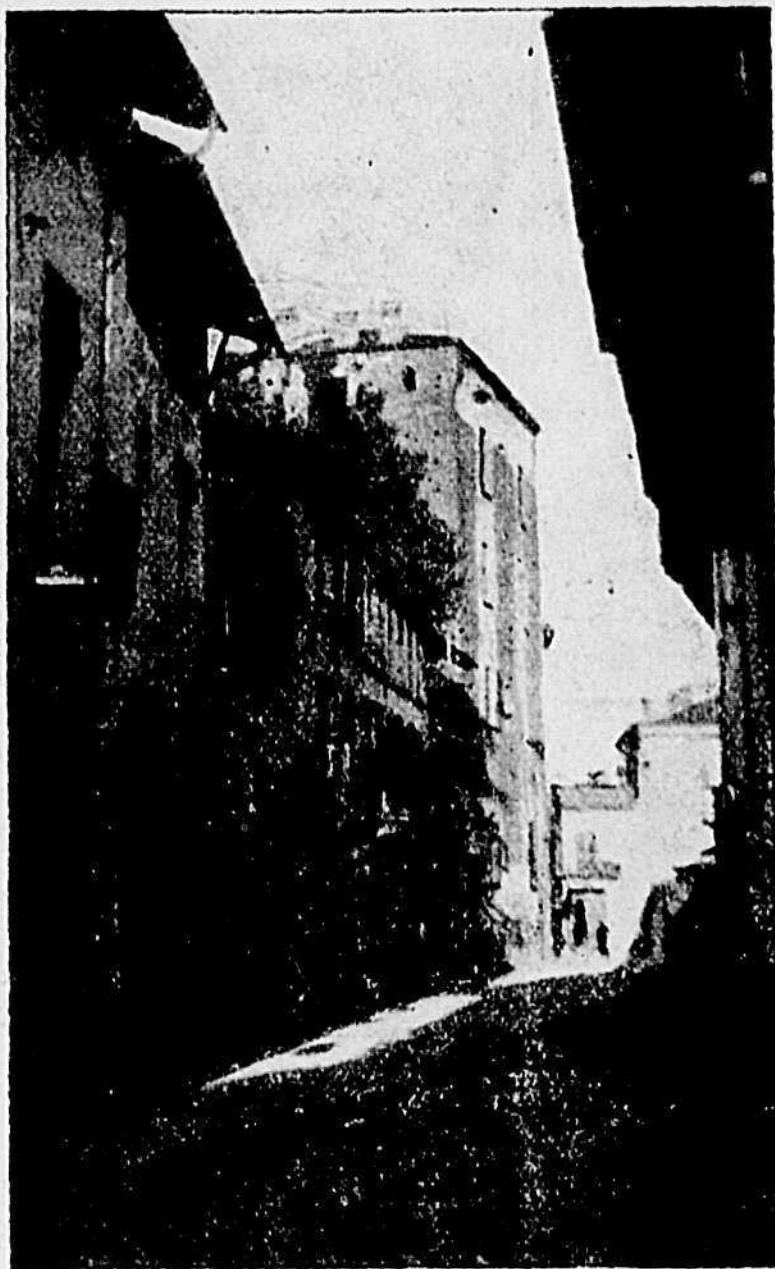
Una strada di Vigone

Fortunatamente non furono rovinati, la Pieve di S. Maria degli Orti del XIII secolo, la chiesa di Santa Caterina, la confraternita di S. Bernardino nella cui chiesa eretta nel 1504 sotto l'invocazione della S. Croce ammiransi pitture del Padre Pozzi; e la canonica della parrocchia di