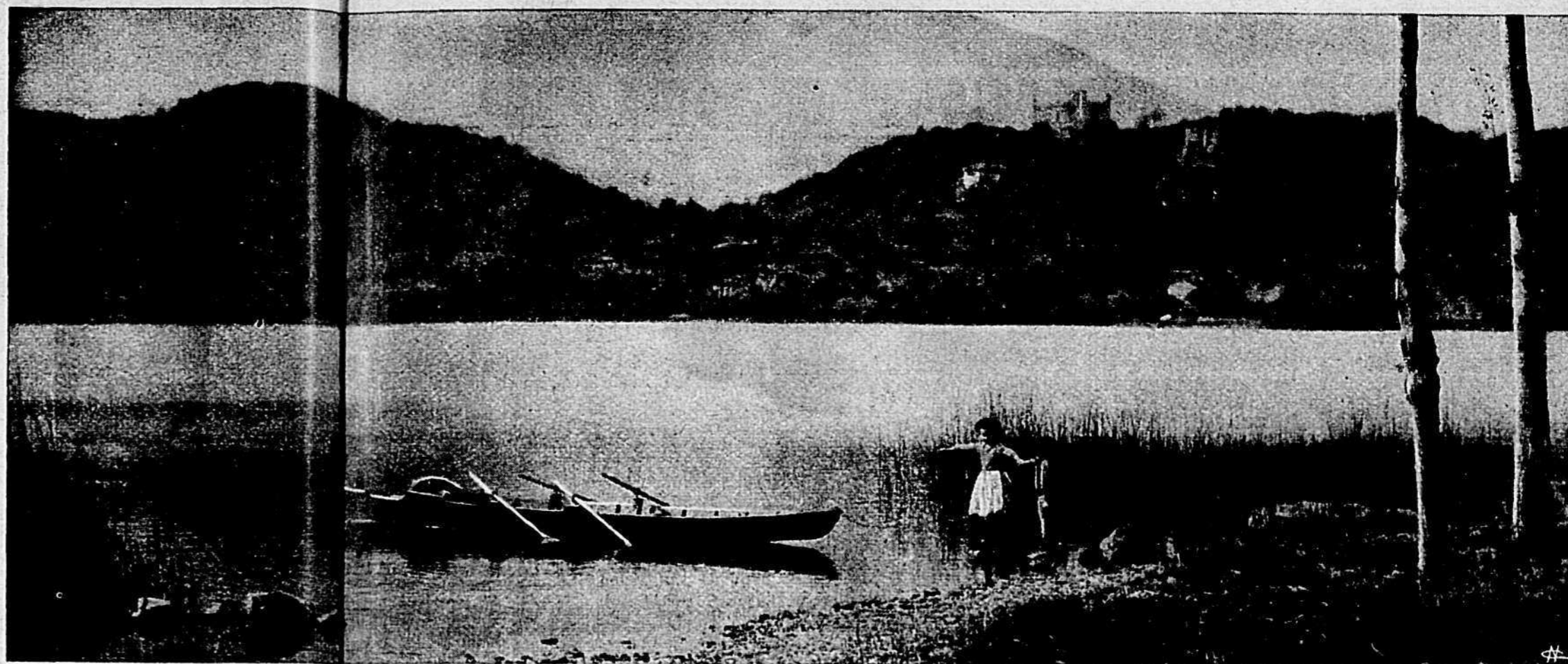
Il Lago Sirio detto di S. Giuseppe (m. 300 sul livello del mare).

dominante i monti circostanti, e la valle che si stende ai piedi, di quanta meraviglia s'empiranno gli occhi nostri, quando giungeremo lassù dopo due ore di cammino. Ad Andrate, visitati i pochi avanzi di un tempo, mura diroccate, la parrocchiale, che fu punto di osservazione astronomica per l'insigne padre Beccaria, e la chiesetta storica del camposanto; penseremo tutti che la nostra gita non fu vana, se alla mèta trovammo pei nostri sguardi tale meraviglioso anfiteatro di monti, e tanta infinita distesa di piano.