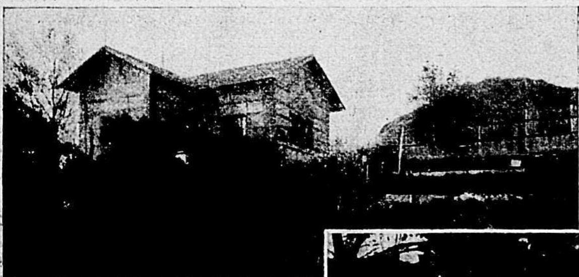
Il Chalet della Società Canottieri « Lago Sirio ».

« Un bel sole ed un tepore primaverile ci arridano » ecco quanto chiunque abbia in animo di prender parte a questa gita deve augurarsi. Chè se talvolta il motivo per cui ci si propone la visita di siti a noi ancora ignoti, è d'ordine precipuamente artistico e di coltura, nel caso nostro, invece, sarà la bellezza naturale dei luoghi, quella che ci farà ampia messe dei nostri caldi entusiasmi.