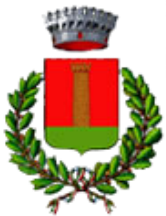
Comune di Roccaverano